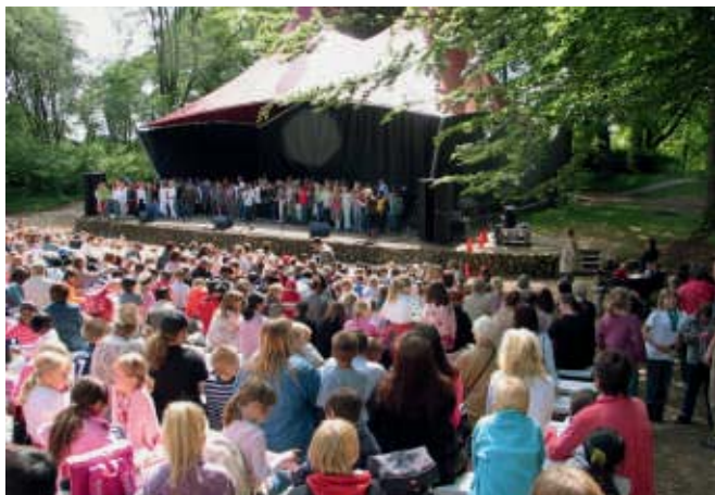
Det er en stærk musikalsk oplevelse for deltagerne at optræde for hinanden, venner og familie på den store friluftscene i Lunden.