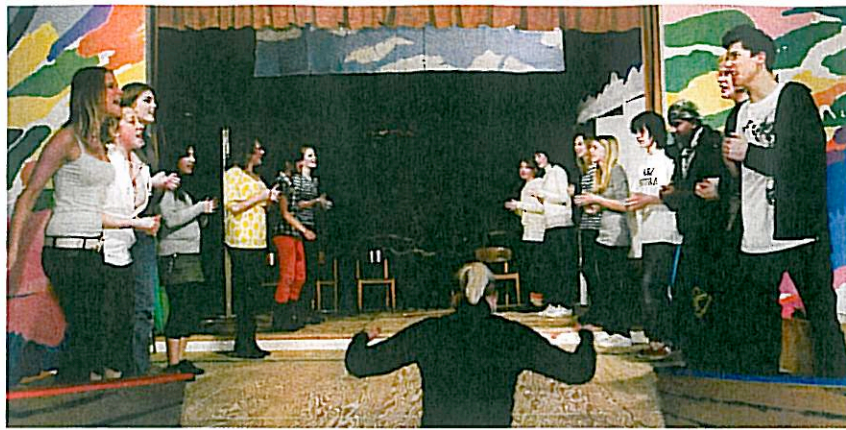
Der bliver sunget igennem når man laver musical på Søndermarkskolen i Horsens. Og etniske grænser falder.

› sprog og kultur. Det følges af en forsker og sigter mod at give erfaringer som andre skoler rundt omkring i landet kan bruge.